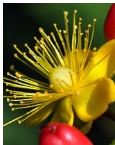
Hypericum x inodorum