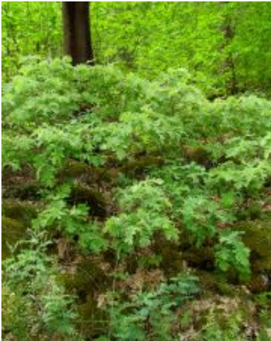
Quercus x andegavensis