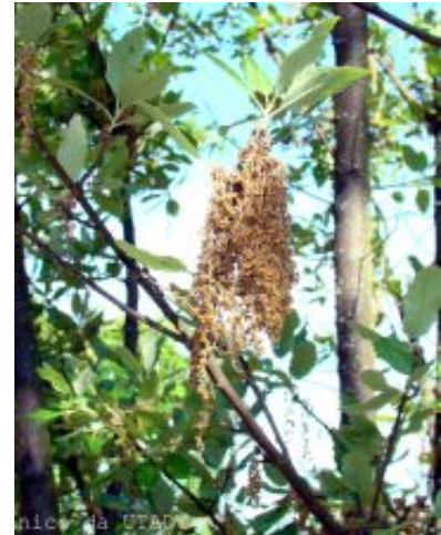
Quercus x hispanica