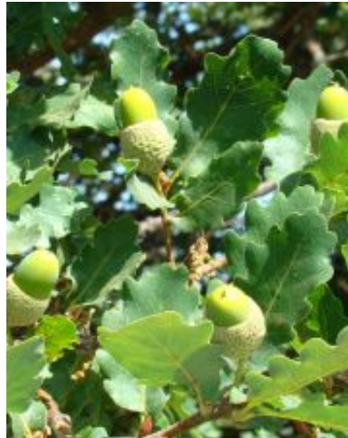
Quercus x coutinhoi