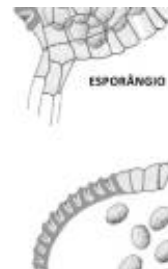
Afirmção 1 A