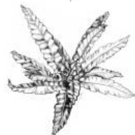
Afirmção 3 A