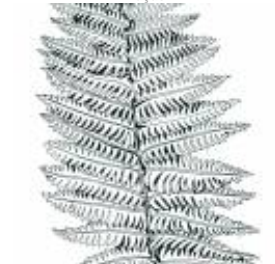
Afirmção 5 A