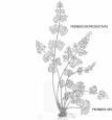
Afirmção 3 B