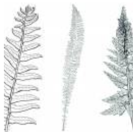
Afirmção 6 A