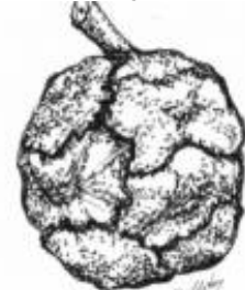
Afirmção 2 A