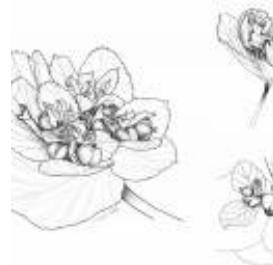
Afirmação 12 A