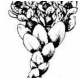
Afirmção 6 A