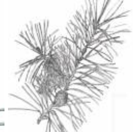
Afirmção 3 B