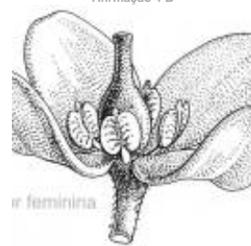
Afirmção 4 B