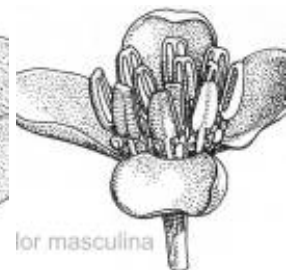
Afirmção 11 A