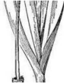
Afirmção 13 B