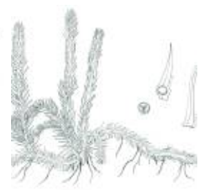
Afirmção 4 B