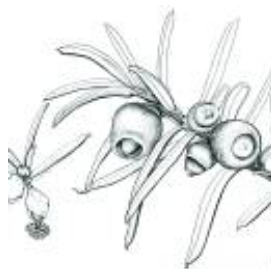
Afirmação 6 A