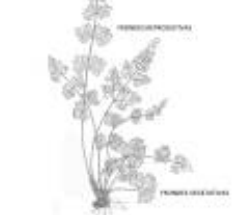
Afirmção 2 B