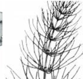
Afirmção 4 A