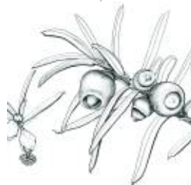
Afirmção 5 A