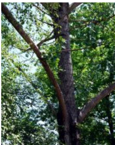
Populus x canescens