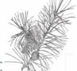
Afirmção 3 B