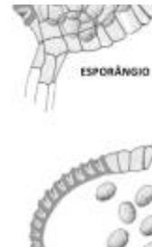
Afirmção 1 A