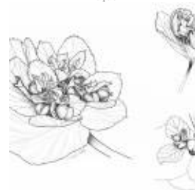
Afirmção 12 A