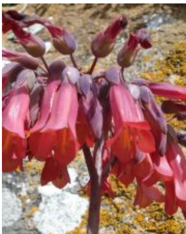
Kalanchoe x houghtonii