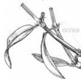
Afirmção 8 A