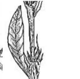
Afirmção 8 A