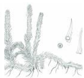
Afirmção 4 B