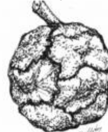
Afirmção 2 A