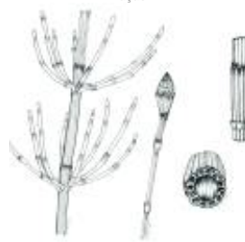
Afirmção 6 A