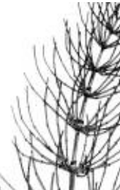
Afirmção 6 A