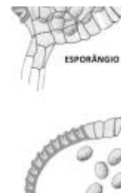
Afirmção 3 A