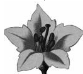
Afirmção 4 B