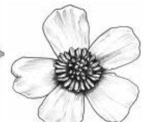
Afirmção 9 A