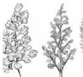
Afirmção 3 B