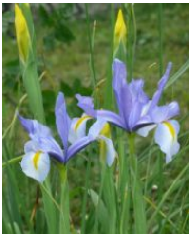
Iris x hollandica