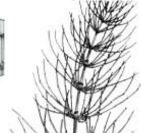
Afirmção 5 A