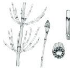
Afirmção 5 A