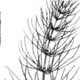
Afirmção 5 A