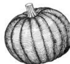
Afirmção 8 B