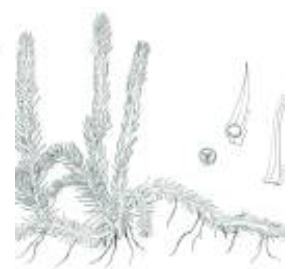
Afirmção 4 B