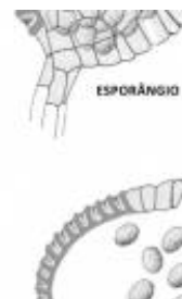
Afirmção 1 A