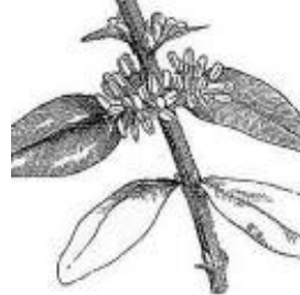
Afirmção 2 A