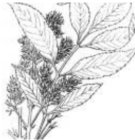
Afirmção 1 B