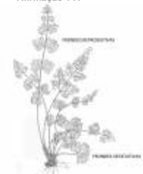
Afirmção 2 B