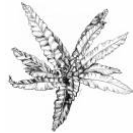
Afirmção 3 A