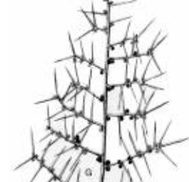
Afirmção 11 B