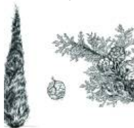
Afirmção 4 B