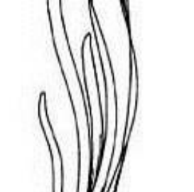
Afirmção 9 A