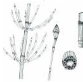
Afirmção 3 A