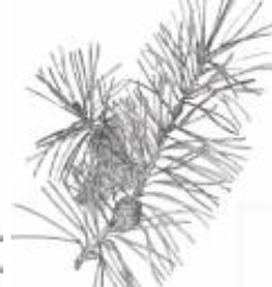
Afirmção 3 B