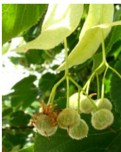
Tilia x europaea