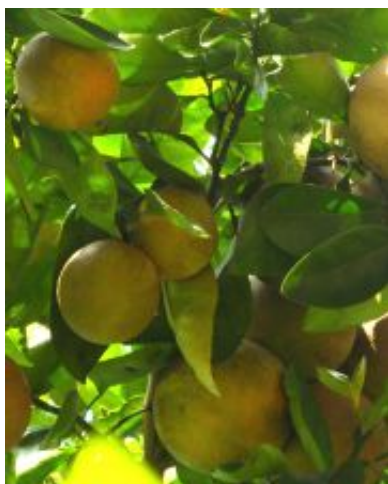
Citrus x sinensis