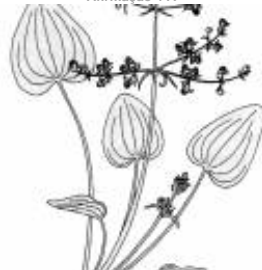
Afirmção 5 B