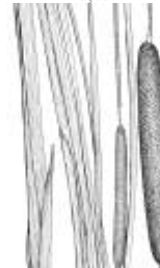
Afirmção 12 B