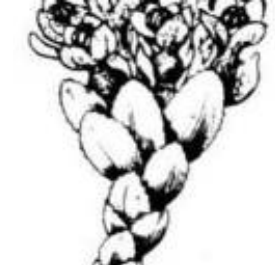
Afirmção 6 A