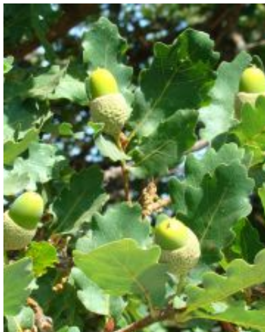
Quercus x coutinhoi