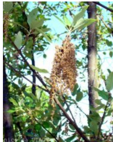
Quercus x hispanica