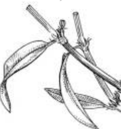
Afirmção 19 A