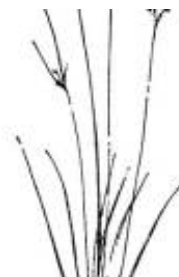
Afirmção 13 A