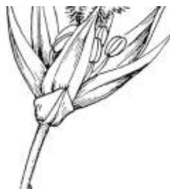
Afirmção 13 A

Folhas reduzidas a escamas ao longo dos caules transformados em