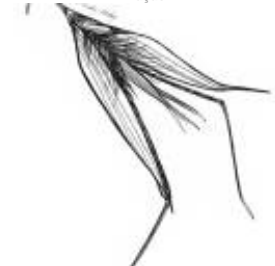
Afirmção 12 B