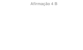
Afirmção 4 B