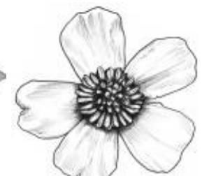
Afirmação 9 A