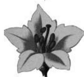
Afirmação 4 B