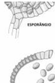
Afirmção 1 A