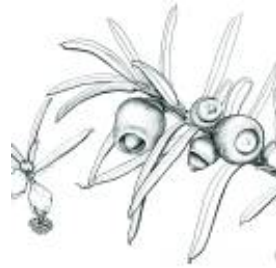
Afirmação 6 A