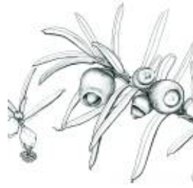
Afirmação 6 A