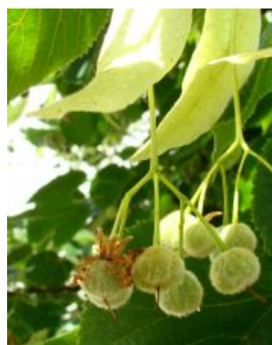
Tilia x europaea