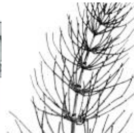
Afirmção 4 A