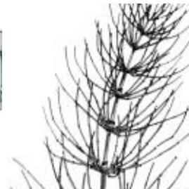
Afirmção 4 A