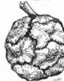
Afirmção 2 A