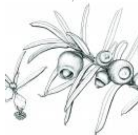
Afirmção 3 A